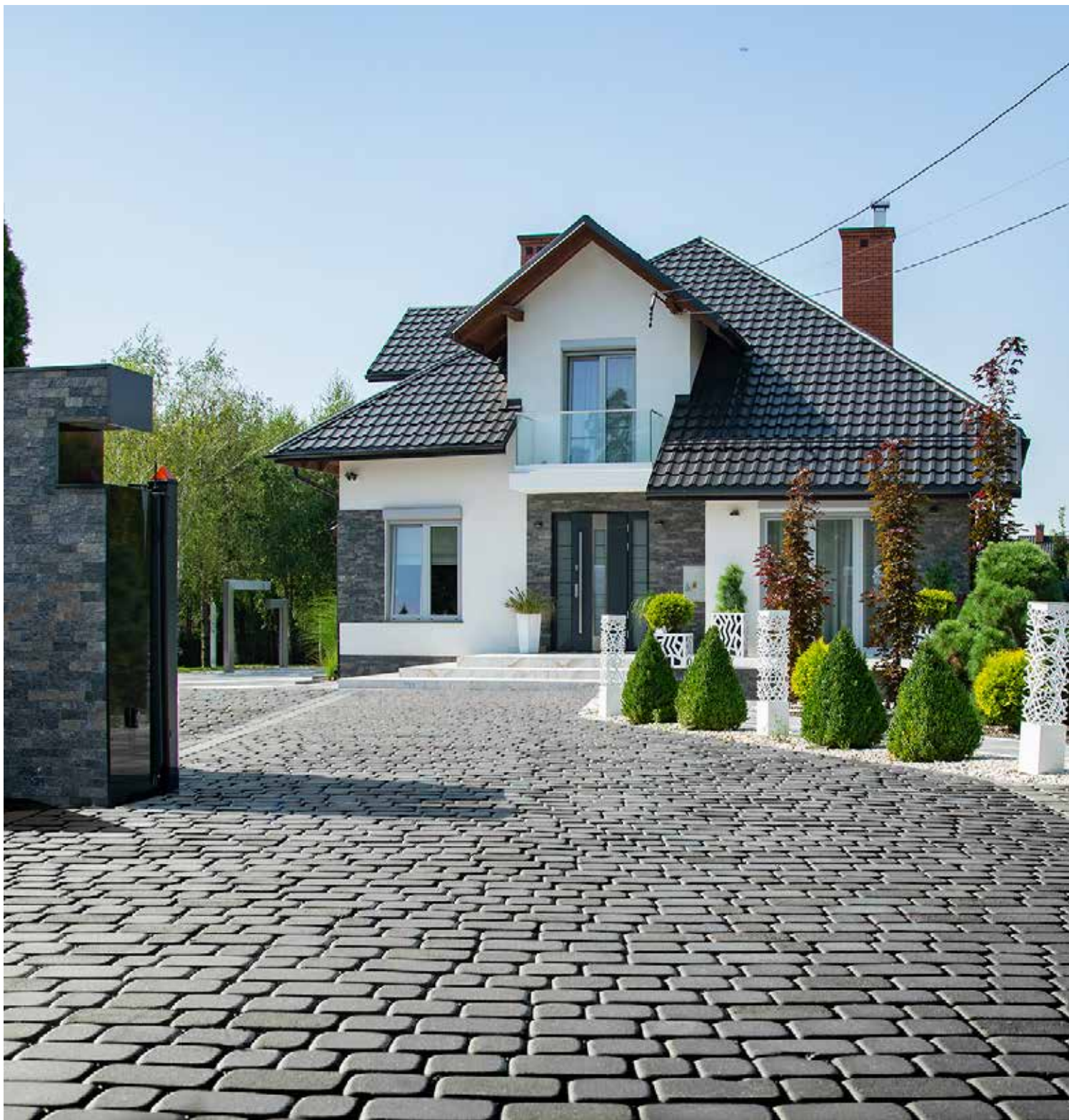
STYROBUD NOSTALIT - GRAFIT