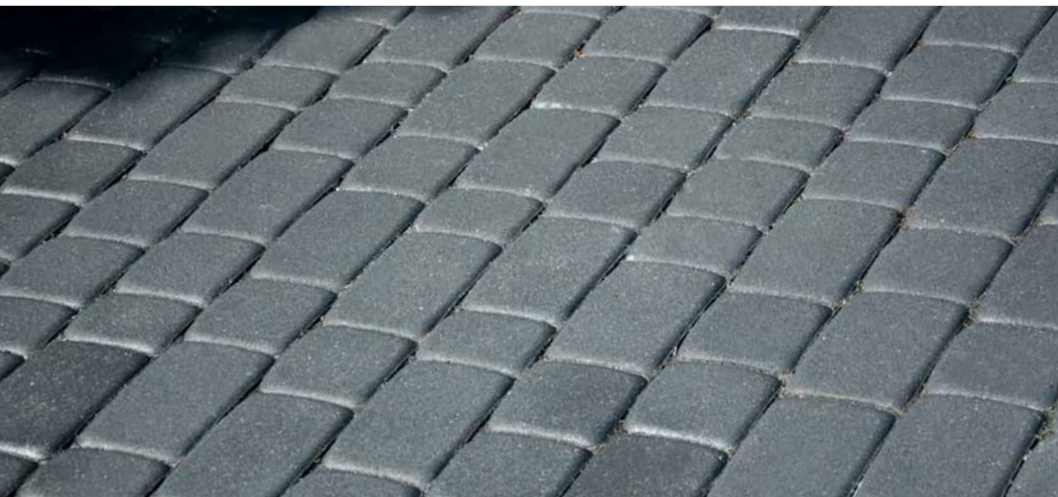
STYROBUD NOSTALIT - GRAFITOWY

Kostki brukowe STYROBUD NOSTALIT oferowane są w formie kwadratu 12x12 cm oraz prostokątów 12x9 cm i 12x18 cm o grubości 4 i 6 cm i zaokrąglonych wierzchołkach. Pięć standardowych barw pozwala na dostosowanie koloru nawierzchni do potrzeb inwestora.