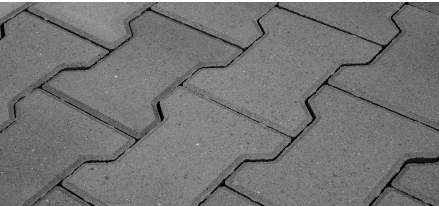
STYROBUD BEHATON™ - SZARY

W ofercie STYROBUD dostępne są kostki BEHATON o grubości 6 i 8 cm z fazą, w pięciu podstawowych kolorach. Na zamówienie wykonywana jest również w wersji bez fazy, dzięki czemu może być wykorzystywana również na ścieżkach spacerowych czy rowerowych.